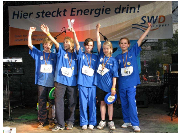
Das „Dream Team DSV‘05“ schaffte es beim Burginsellauf auf den 2. Platz